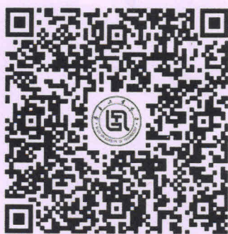
ICPC济南站参赛费缴费通道

本次比赛食宿及往返交通费自理，无补助。每支参赛队伍需缴纳参赛费人民币 1500 元，齐鲁工业大学将为各参赛院校统一开具内容为“参赛费”的增值税普通电子发票。请贵校在 2023 年 11 月 17 日前，扫码付款，填写发票信息，并备注“ICPC+贵校名称+教练名”。