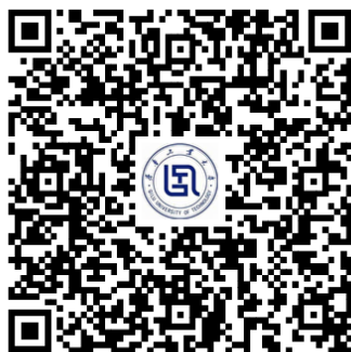
ICPC济南站参赛费缴费通道

(2)确 无法扫码付款的 ，可通过银行 汇款 至指定账户（该方式对账时间较长，不建议使用这种方式）。 对于使用此方式缴费的队伍，请将缴费凭证截图、单位、税号、单位地址及电话、开户银行及账号、发票接收邮箱、ICPC+高校名称+教练姓名、联系人姓名及电话 ，发送 邮件 至赛站邮箱 qluicpc@163.com，主题为“银行汇款缴费-XX 学校 XX 教练参赛队伍”